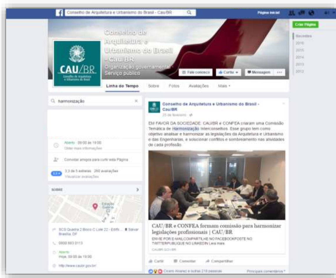
Matéria no Facebook do CAU/BR